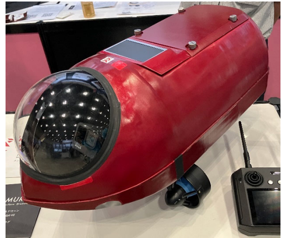
超小型水上ドローン『Swimmy Eye V1』

展示を行った超小型水上ドローン『Swimmy Eye V1』は、狭くて点検しづらい小さな橋梁や草が生い茂る護岸・水門など、人が近づきにくい場所・飛行ドローン/水中ドローンが苦手な場所の点検・測量作業が得意な製品です。